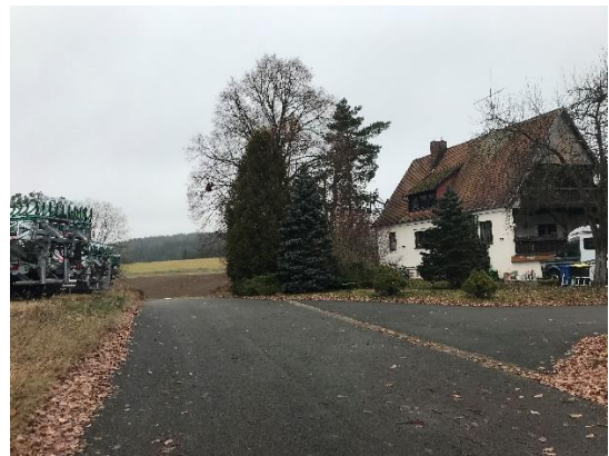
Abb. 10: Wohnhaus mit strukturreichem Garten auf Flur-Nr. 547/2 und Zufahrt