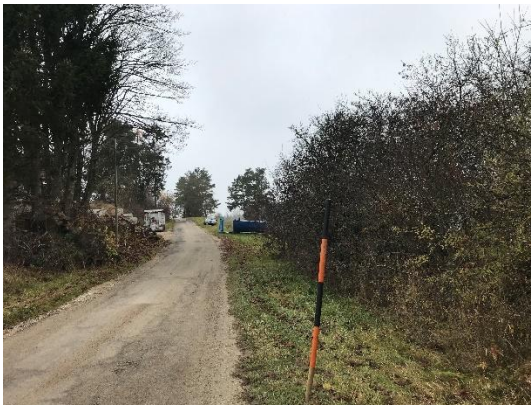
Abb. 7: größtenteils heimische Gehölzbestände entlang der Straße „Ziegelhütte“