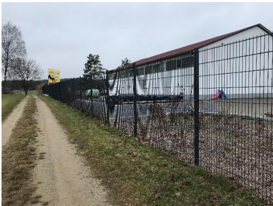
Abb. 13: gewerbliche Nutzung auf Flur-Nr. 547/1 und Feldweg entlang der westlichen Geltungsbereichsgrenze