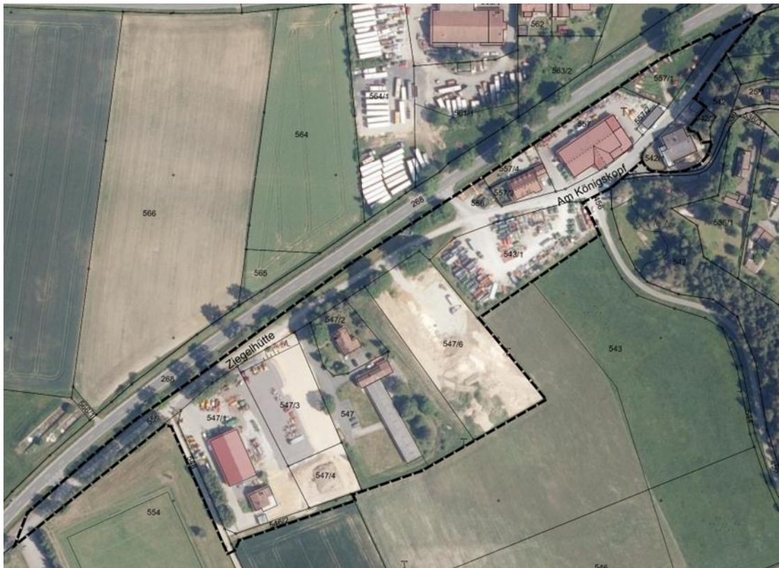
Abb. 15: Luftbild des Plangebietes aus dem Jahr 2014