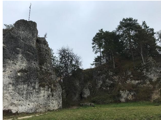
Abb. 4: Naturdenkmal und Geotop „Dolomithfelsen Königskopf“, außerhalb Geltungsbereich