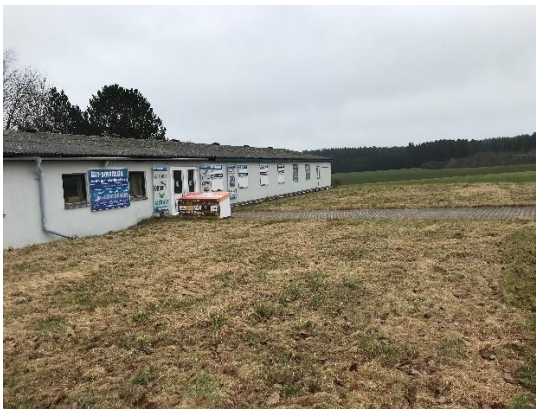
Abb. 11: gewerbliche Nutzung und intensive Wiesenfläche auf Flur-Nr. 547