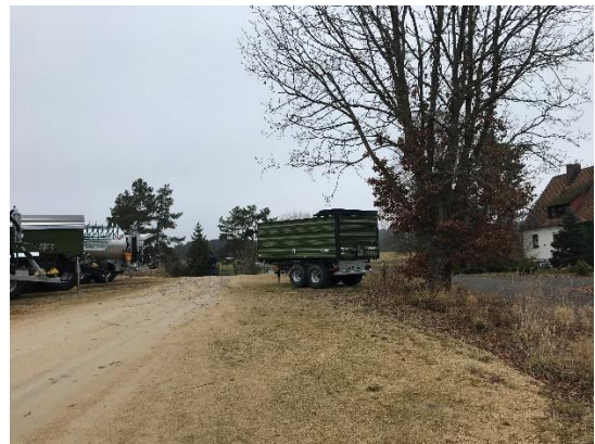
Abb. 12: mittelalte Eiche auf Saumstreifen zwischen Flur-Nr. 547 und 547/3, links: Lagerfläche auf 547/3