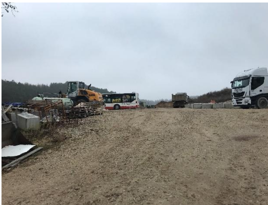
Abb. 9: Lagerfläche und Deponie auf Flur-Nr. 547/6