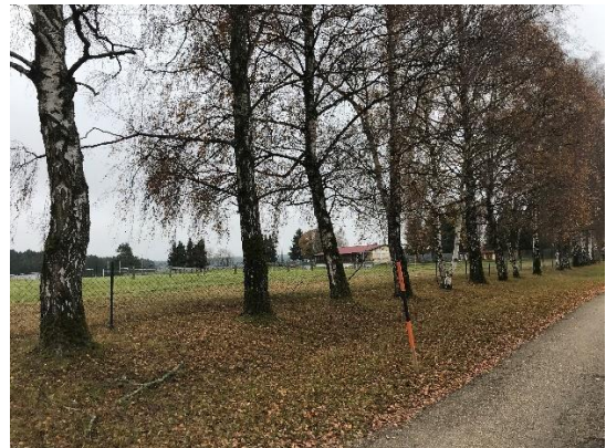
Abb. 14: Baumreihe aus Birken entlang des Sportplatzes

Das Landschaftsentwicklungskonzept (LEK) Oberfranken-Ost bewertet die Lebensraumqualität für Arten im Umkreis der Ortschaft Bronn als überwiegend gering bis überwiegend mittel und sieht ein Entwicklungspotenzial für bayernweit potenziell häufige Lebensräume.