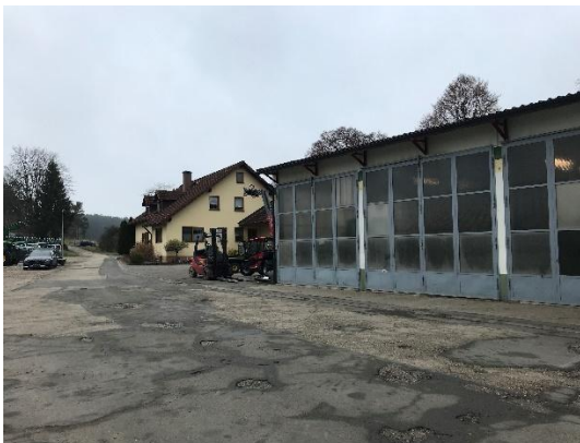
Abb. 5: Bebauung im Nordosten (Flur-Nr. 557, 557/3), Landmaschinenhändler und Wohnhaus