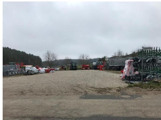
Abb. 6: geschotterte Lagerfläche auf Flur-Nr. 543/1