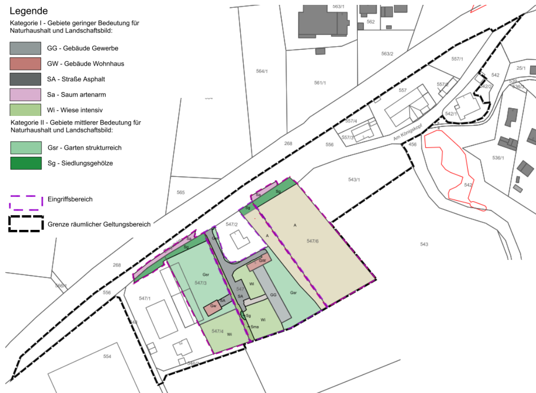
Abb. 16: Bestandsplan Grünordnung mit Bewertung für den Ausgangszustand (Kataster: Bayerische Vermessungsverwaltung)