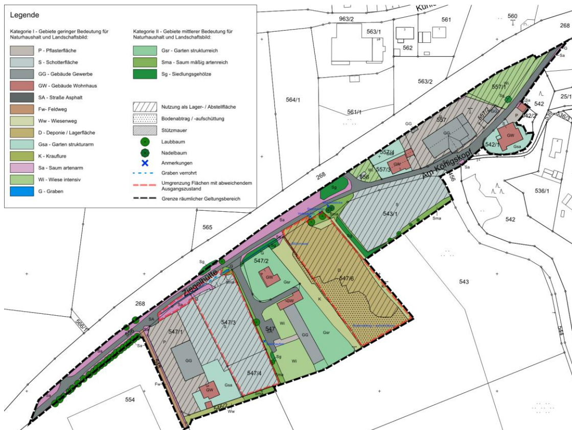
Abb. 2: Bestandsplan Grünordnung mit Bewertung (Kataster: Bayerische Vermessungsverwaltung)