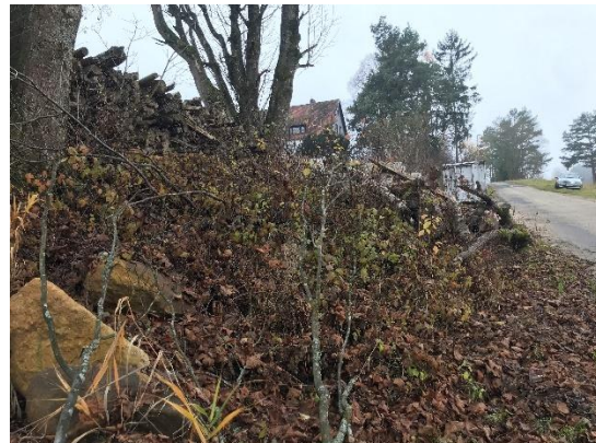
Abb. 8: Stein- und Holzhaufen am Straßenrand, nördlich von Flur-Nr. 547/6