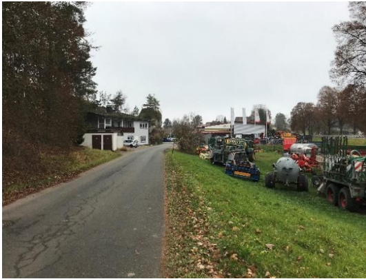
Abb. 3: Blick von der nordöstlichen Ecke entlang der Straße „Am Königskopf“, rechts: Wiese mit Lagerfläche