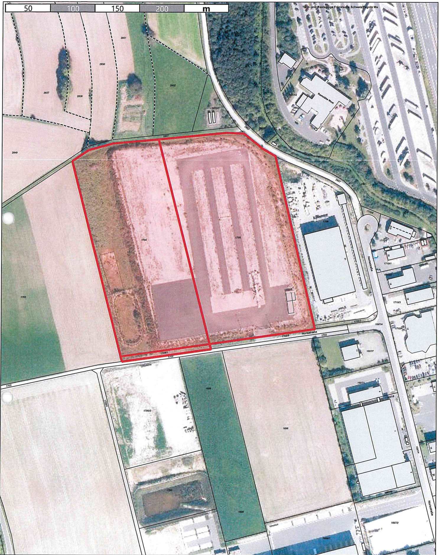
Anlage 2 zu TOP Ö5