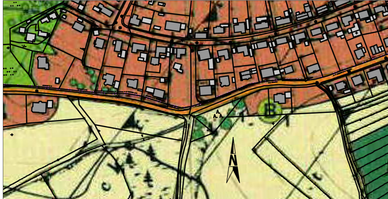
Rechtsgültiger Flächennutzungsplan vor der Änderung M = 1 : 2500