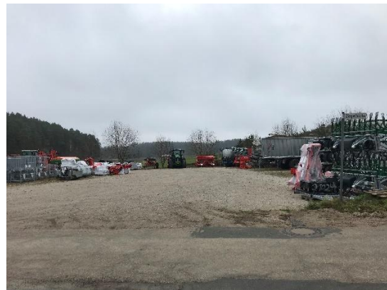
Abb. 6: geschotterte Lagerfläche auf Flur-Nr. 543/1