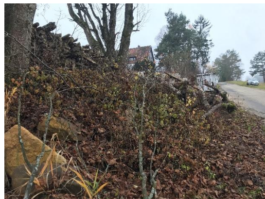
Abb. 8: Stein- und Holzhaufen am Straßenrand, nördlich von Flur-Nr. 547/6